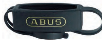
PROTECTOR DE CILINDRO